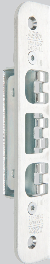
Säkerhetslutbleck Connect 1489-11/1489-12