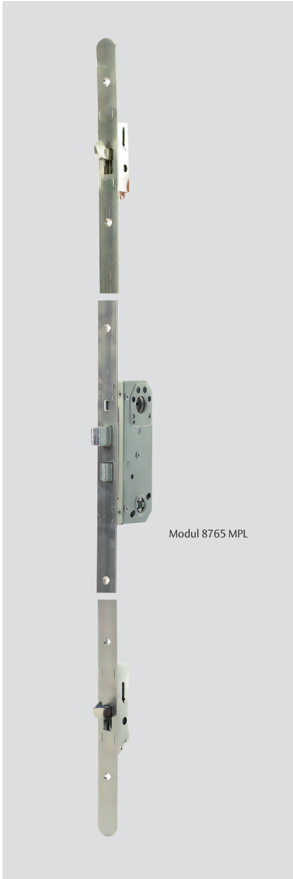
Modul 8765 MPL

ASSA ABLOY, the global leader in door opening solutions