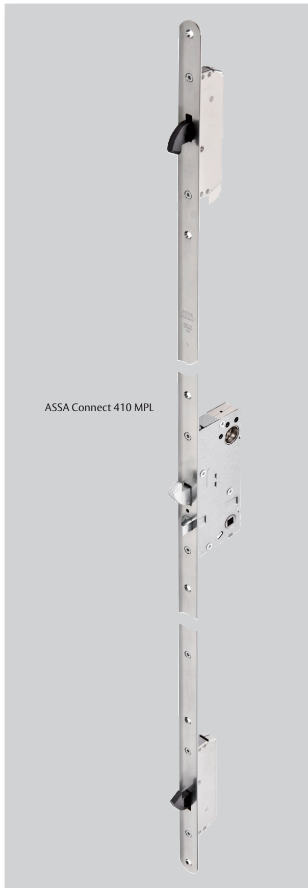
ASSA Connect 410 MPL